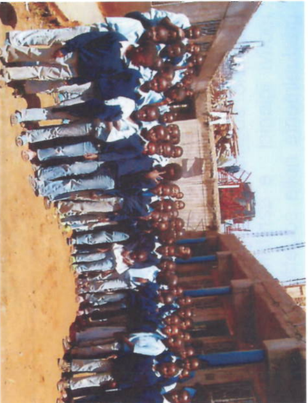
Bambine riunite nel villaggio in costruzione

Sull’arco di 6 anni è stato possibile costruire un nuovo edificio di 3 piani. Attualmente la struttura accoglie già 300 bambine orfane di età compresa tra i 5 e 18 anni. Per mancanza di fondi alcune importanti rifiniture devo essere ancora ultimate. Siamo alla ricerca di donazioni che permettano di terminare questo importante progetto.