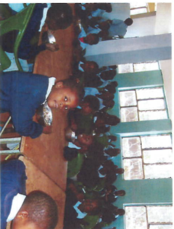
Bambine nella mensa del villaggio