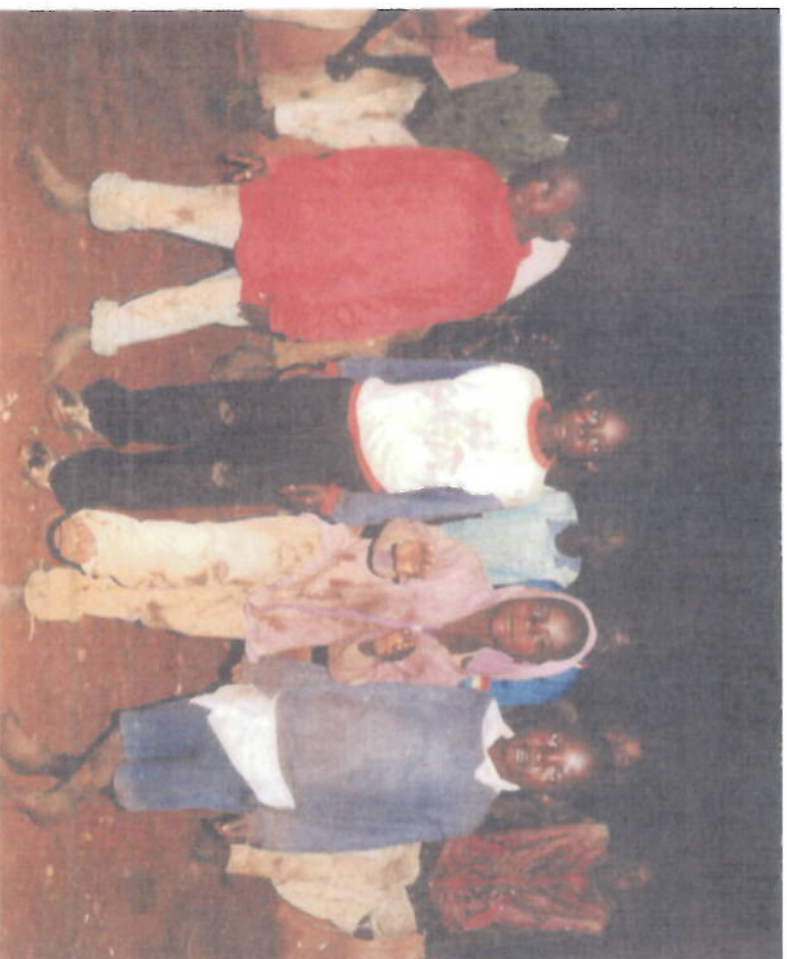
I ragazzi di strada fotografati a mezzanotte a Meru.

Ai ragazzi/ragazze di strada, che rifiutano un inserimento nella società e/o che non è possibile accogliere nel villaggio San Francesco per mancanza di posti letto, viene garantito due volte alla settimana un pasto a base di latte e pane.